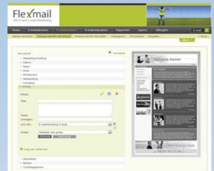
Landing pages in de wizard